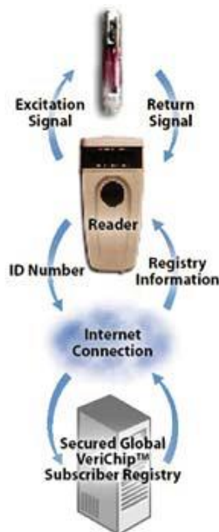
Figura II. Funcionamiento del Verichip

Con una dimensión similar a la de un grano de arena, cada dispositivo RFID Verichip contiene un número de verificación único, que permite el acceso a una base de datos con información sobre una de esas personalidades.