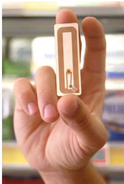
Figura I. Rótulo RFID

La RFID promete introducir un cambio en ese paradigma informático, de modo tal que, en el futuro, no sólo las personas y sus dispositivos de comunicación estarán conectados a redes mundiales, sino que también lo estará un gran número de objetos inanimados, desde neumáticos hasta navajas de afeitar. Las aplicaciones de la RFID permitirán la compilación automática y autónoma de datos sobre todas las cosas que vemos y utilizamos en nuestro entorno, creando de ese modo, espacios de red verdaderamente inteligentes y ambientales.